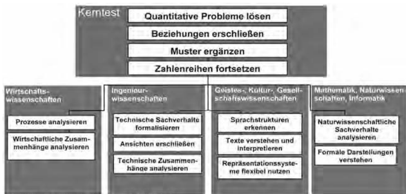
Abbildung 2. Übersicht über die Module des TestAS.

Übersetzung ins Englische und die Überprüfung der Äquivalenz der deutsch- und der englischsprachigen Aufgaben. Bei der Aufgabengruppe »Beziehungen erschließen« werden die Aufgaben zusätzlich von einem weiteren Übersetzer zurückübersetzt, da diese Aufgaben besonders sensibel auch für scheinbar kleine Bedeutungsunterschiede einzelner Begriffe sind, welche sich bei der Übersetzung einschleichen können. Die Aufgaben der fachspezifischen Module werden vor und nach der Übersetzung von Fachexperten auf die fachliche Korrektheit geprüft.